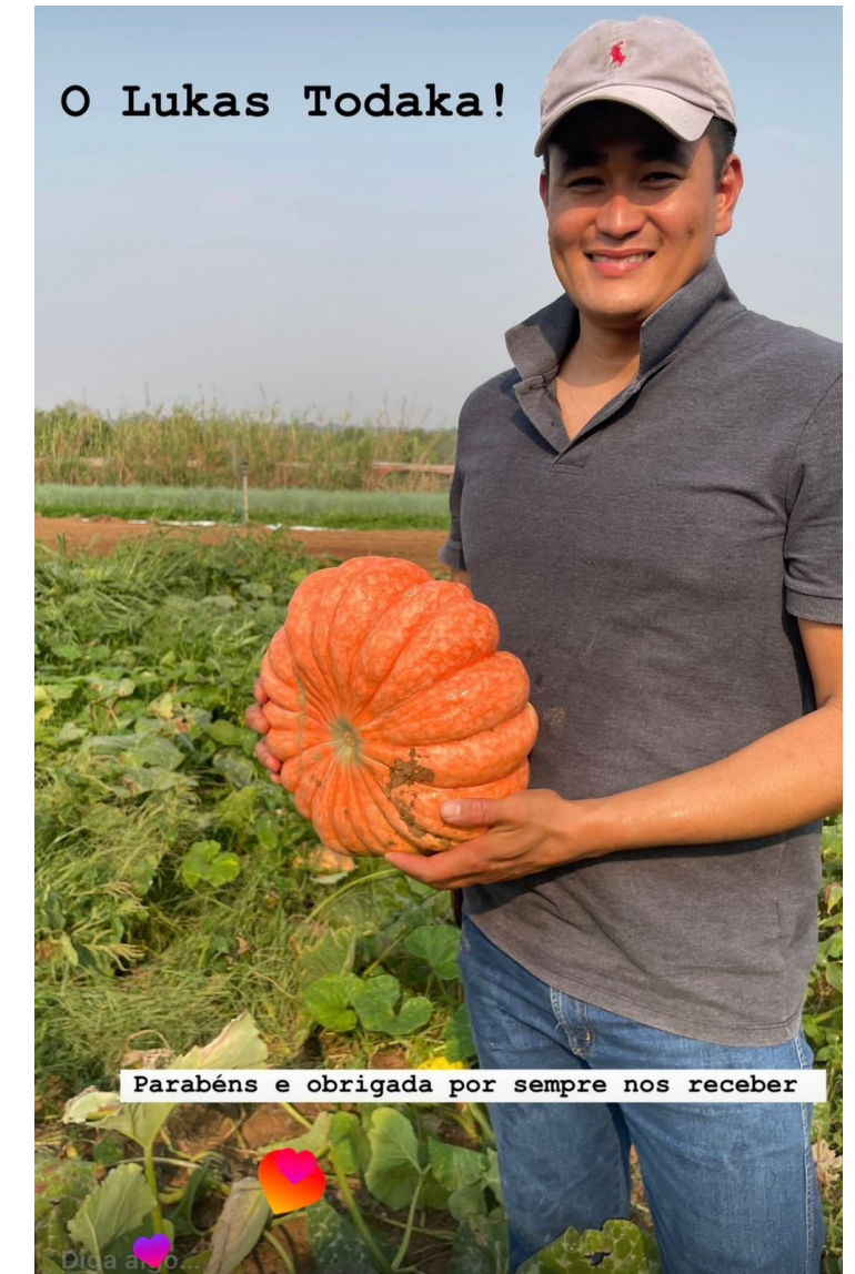
Realização de dissertações em áreas de produtores