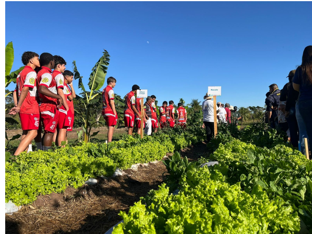
Ação educativa com alunos